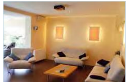
Rückansicht: Lediglich der direkt an der Decke montierte Projektor und die Fernbedienung auf dem Tisch lassen erahnen, dass sich dieser Raum in ein echtes Heimkino verwandeln lässt

Nicht umsonst heisst es Wohn- statt Boxenzimmer.