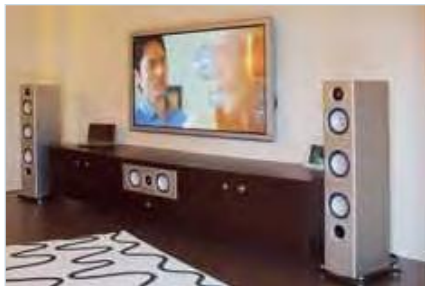
Aufgeräumt: Center sowie die gesamte Zuspield elektronik sind unsichtbar in diesem schwebenden Medienrack untergebracht