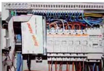
So klein kann clever sein: Das gesamte ReCon-System-Management ist gerade einmal so groß wie eine Zigarettenschachtel und kann problemlos im Verteilerkasten untergebracht werden